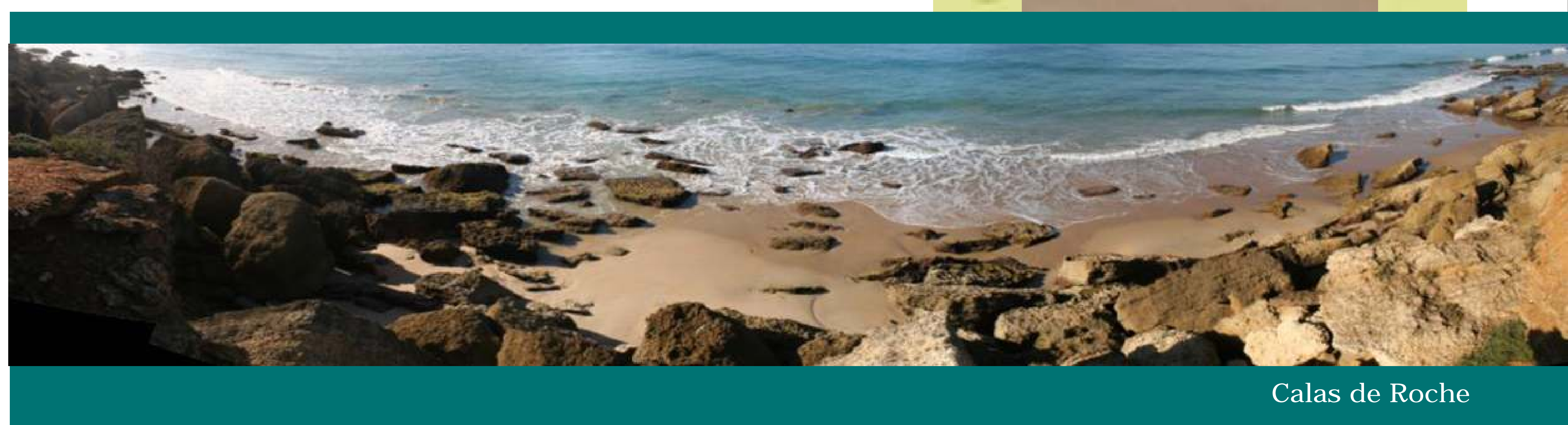
Calas de Roche

Entre todos los seres vivos destacan las aves, que toman a estas tierras por punto de avituallamiento en sus migraciones. Sobresalen asimismo por su rareza o delicado estado de conservación algunas especies; es el caso de una margarita que sólo existe en el litoral gaditano llamada Hypochoeris salzmänniana , un pequeño sapo protegido (sapillo moteado ibérico) y una mantis cuya escasez la convierte en la única protegida de Europa.