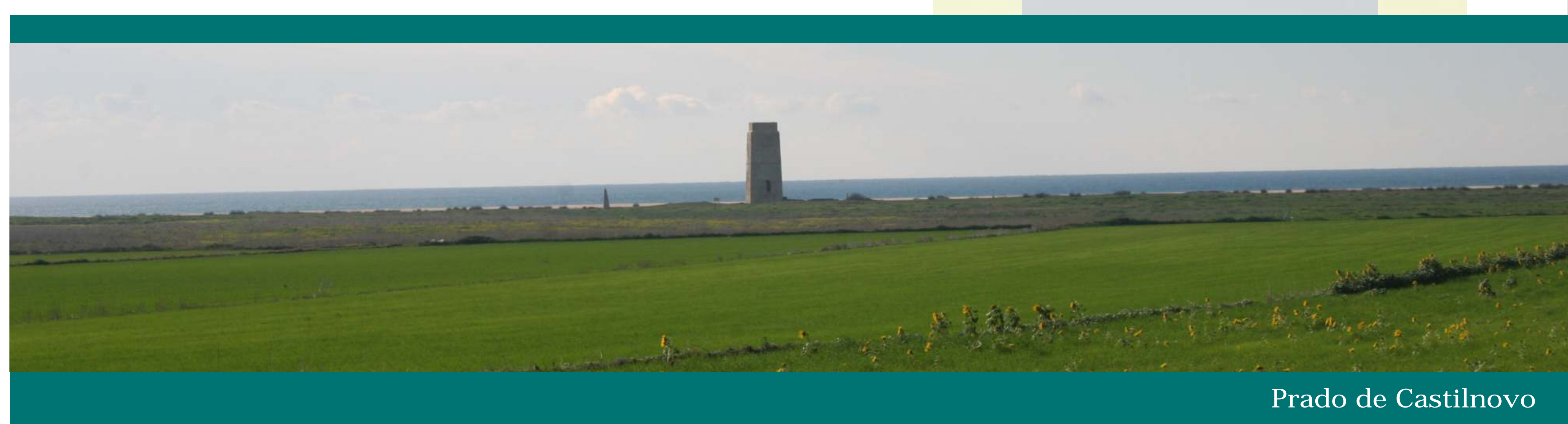
Prado de Castilnovo

A diferencia de otras franjas costeras mucho mayores, el litoral de La Janda concentra en apenas unos 45 kilómetros de costa una reseñable variedad de paisajes en la que se distinguen playas, acantilados, pinares, marismas, dunas o campiña.