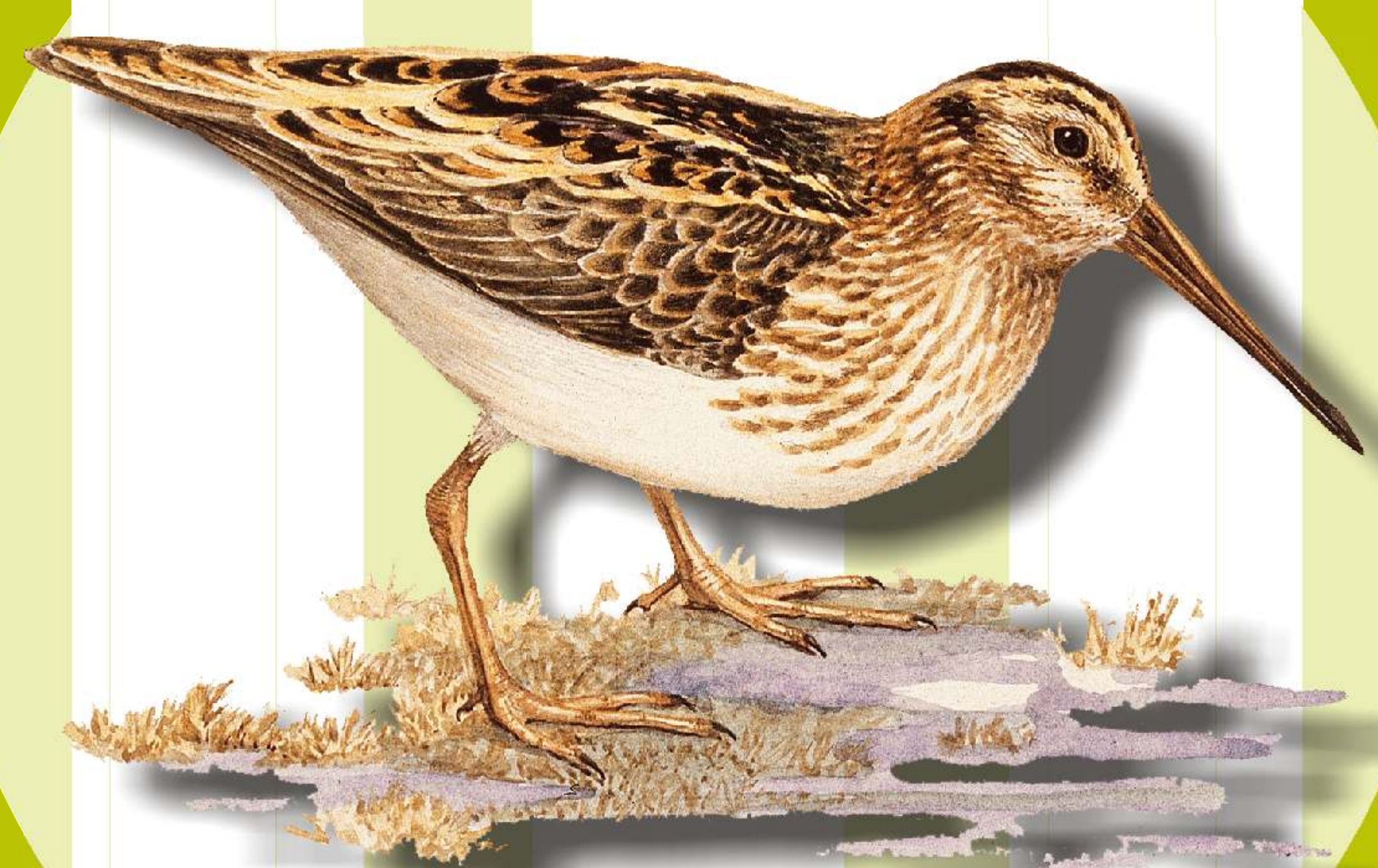
Archibebe común ( Tringa totanus )

A diferencia de otras franjas costeras mucho mayores, el litoral de La Janda concentra en apenas unos 45 kilómetros de costa una reseñable variedad de paisajes en la que se distinguen playas, acantilados, pinares, marismas, dunas o campiña.