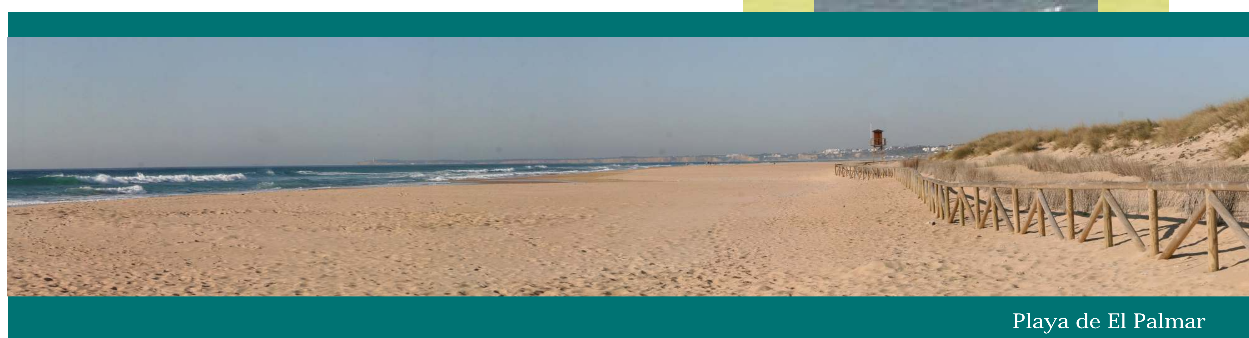
Playa de El Palmar

Si a esta riqueza paisajística se le suma una localización privilegiada (encrucijada entre Europa y África y determinada por la influencia natural de dos mares), tenemos unas condiciones idóneas para el desarrollo de una gran variedad de plantas y animales.