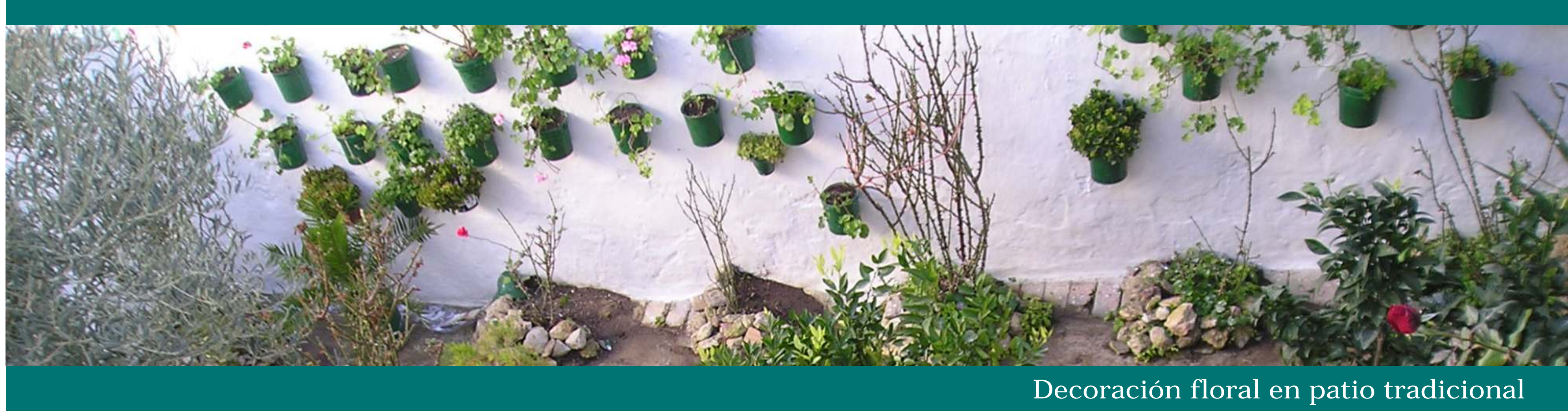
Decoración floral en patio tradicional

De estas casas, en principios unifamiliares, se dio paso con el tiempo a los tradicionales patios de vecinos en los que vivían varias familias. Tradicionales de Conil y Vejer, en sus calles todavía se observan muchos como los de la calle Cádiz o la calle Ancha, en Conil, o la casa Naveda o "Casa de las Viudas", en Vejer. Con servicios comunes y sin comodidades, en los patios siempre había tiempo para la tertulia, el diálogo y la solidaridad. Era una forma de vida absolutamente diferente a la de hoy, en la que todo se compartía y apenas había distinción entre el espacio público y el privado.