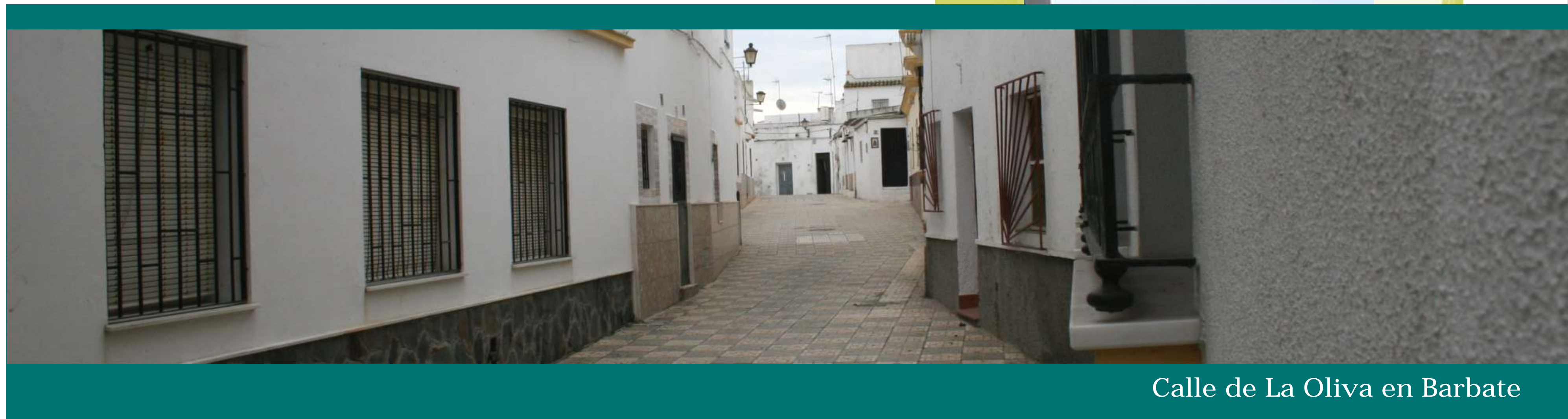
Calle de La Oliva en Barbate