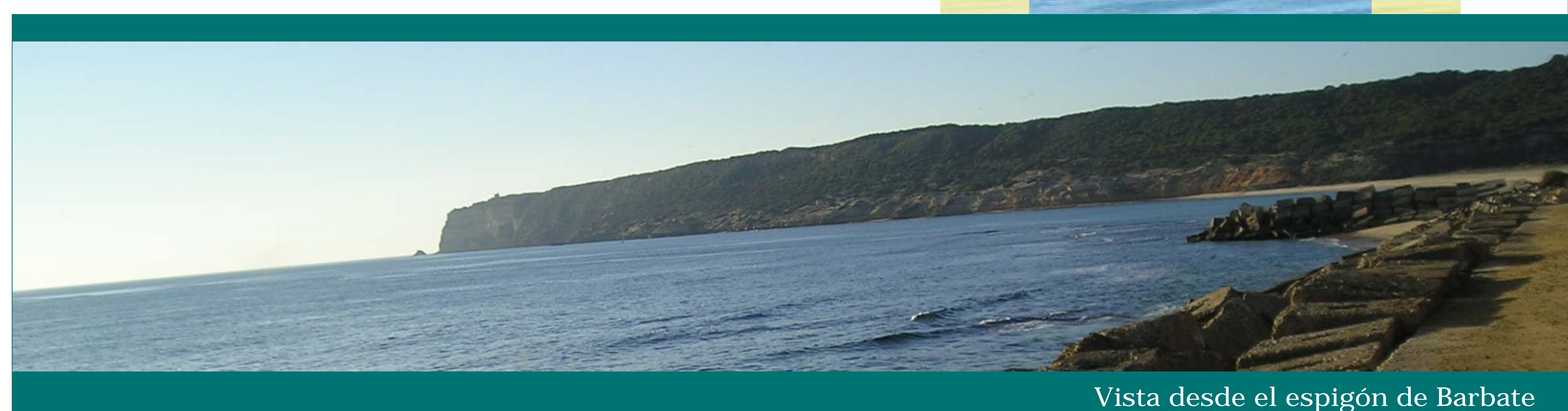
Vista desde el espigón de Barbate

Tantos años dedicados a la mar, han hecho que convivan diferentes tipos de embarcaciones y artes de pesca en la costa de La Janda.