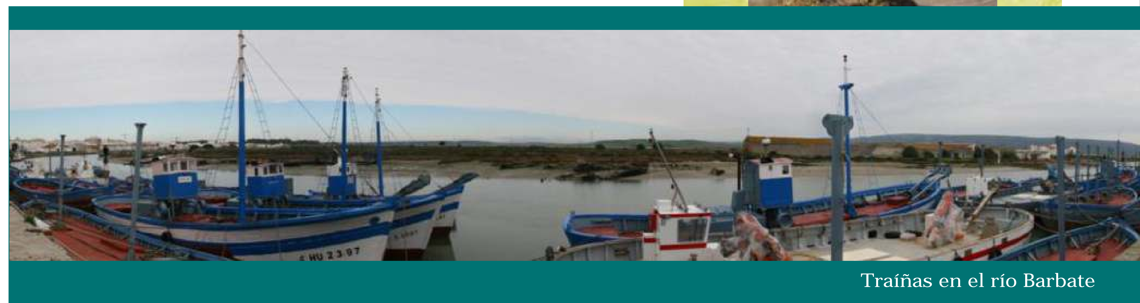
Traíñas en el río Barbate

Al capturar atunes y otros pescados de forma excesiva hemos sido en parte responsables de la crisis de las almadrabas y del sector pesquero en general, pero en nuestra mano está hacer que estas tradiciones y modos de vida no desaparezcan.