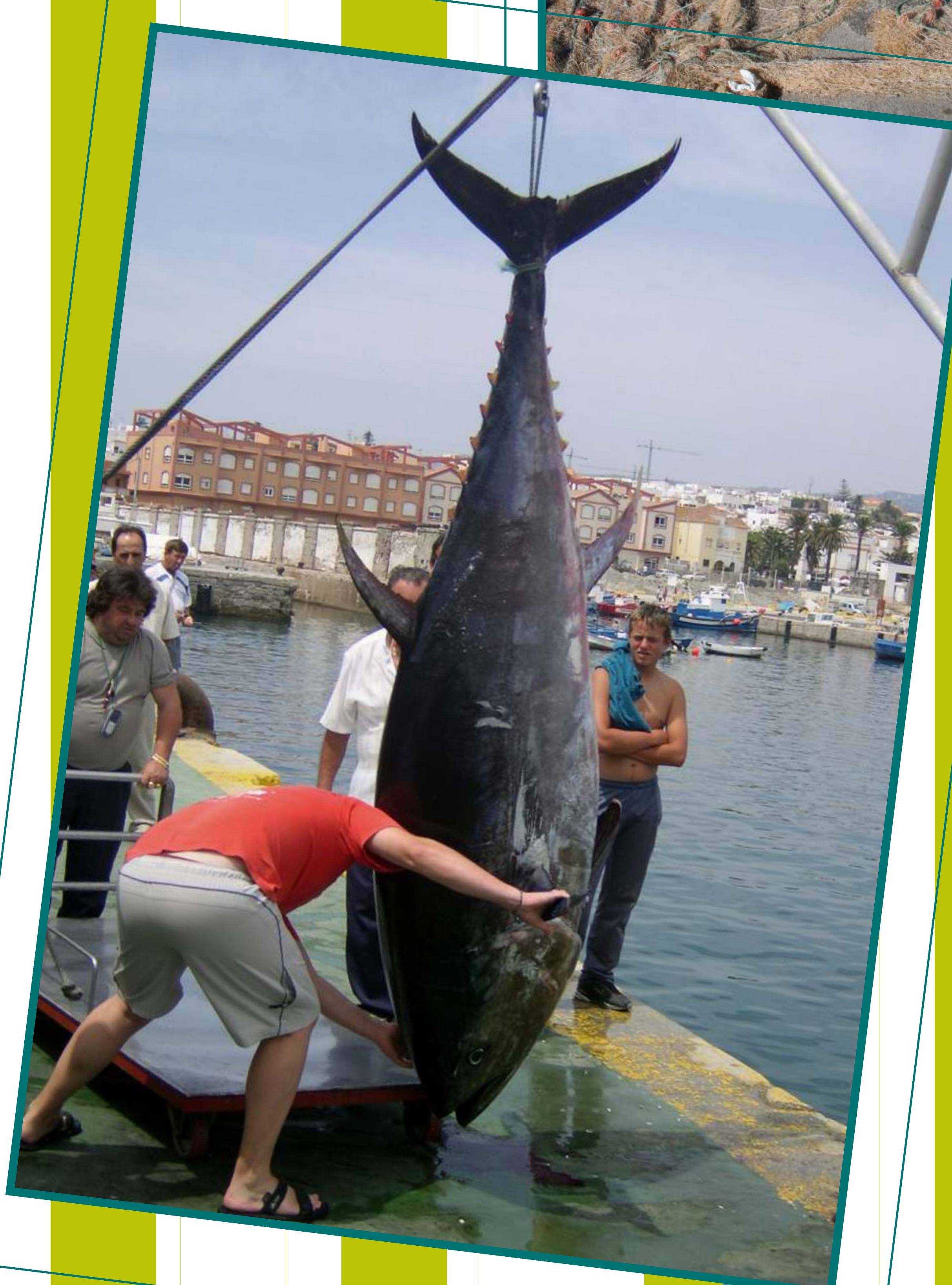
5. La pesca tradicional del atún en almadraba data de tiempos romanos. En la fotografía, momento del pesado de la pieza. 6. Arte de enmalle en el puerto de Barbate. 7. La Jábega.