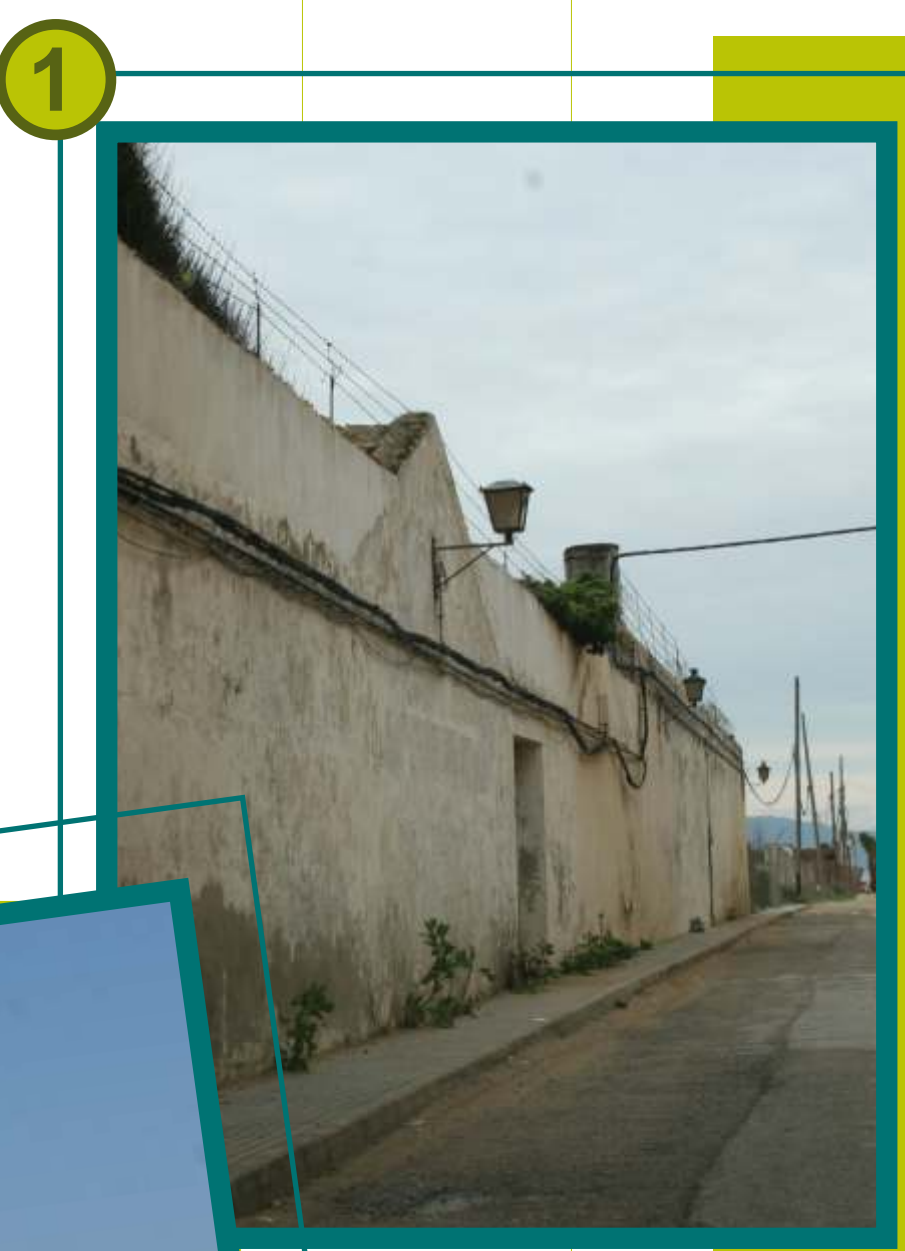
1. La Chanca de Barbate. 2, 3 y 4. Vistas de la flota pesquera de Barbate y sus artes de trabajo.