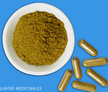
> PLANTAS MEDICINALES