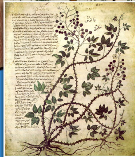
> DIOSCORIDES. LIBRO DE PLANTAS MEDICINALES