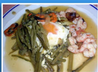
> REVUELTO DE TAGARNINAS