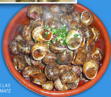
> CABRILLAS EN TOMATE

Todos conocemos sus usos culinarios . ¿Quién no se ha deleitado con un buen plato de caracoles aromatizados con hinojo y poleo o ha saboreado un exquisito guiso de tagarninas o un revuelto de espárragos trigueros?