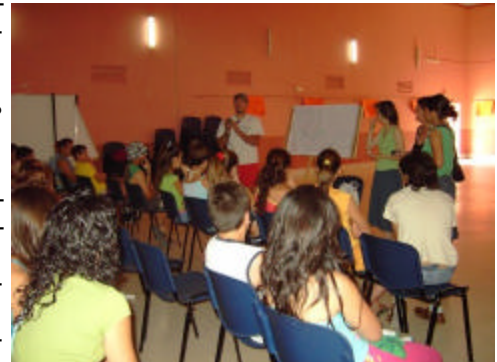
En la imagen, dinámica organizada con jóvenes

Además, para extraer el máximo de información posible sobre los jóvenes participantes así como de otros jóvenes de la comarca, tanto cualitativa como cuantitativamente, sobre aspectos diversos de su vida (ámbito familiar, productivo, educativo, afectivo o de ocio) se ha diseñado un modelo de cuestionario poblacional para chicos y chicas como herramienta metodológica, lo que será de gran utilidad para recopilar datos de una muestra poblacional representativa que ofrecerá información, de pri-