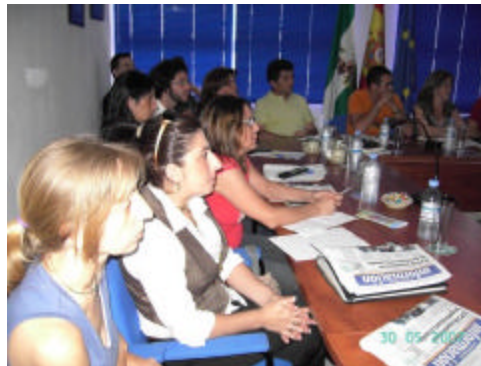
Participantes en una de las mesas temáticas organizada por el GDR de Los Alcornocales

La integración de estos datos con la información de las entrevistas y de los indicadores permitirá elaborar las matrices DAFO temáticas. La planificación estratégica pretende diseñar estrategias que lleven a definir en qué situación está ahora la comarca y cómo quiere la población que esté. La matriz DAFO indica, mediante el análisis de su contenido, en qué punto está la comarca y permite también que se vislumbren caminos que lleven a la consecución de los objetivos. De ahí la importancia de la obtención de datos, de su integración y, por su puesto, de su publicación y difusión que entre otros medios mostramos a través de la web Alcornocales.