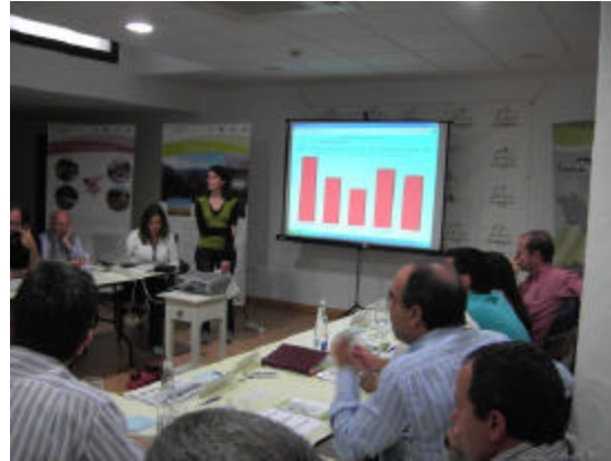
En la imagen, se muestran los resultados que proporciona el software Impact Explorer a partir de las votaciones de los participantes

Se han celebrado ocho mesas temáticas a partir de cuyos resultados se están elaborando matrices DAFOS de análisis sectorial