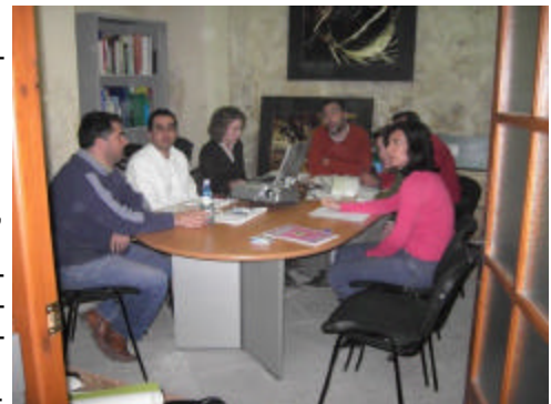
En la imagen, mesa de trabajo organizada por el GDR de la Sierra de Cádiz

El trabajo de los GDR consiste en definir un plan de trabajo que les permita realizar un diagnóstico participativo de su comarca y unas orientaciones de futuro. En este objetivo están inmersos y trabajando día a día sin descanso. Pero el trabajo no queda solo ahí. Los GDR de la provincia están trabajando conjuntamente para realizar una labor mucho más fructífera y de cooperación provincial. Se están compartiendo los resultados del proceso, las dificultades que se han encontrado y las soluciones que mejor respondan a las singularidades de cada territorio.