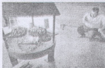
Suomalaisen retkiruuan valmistus ikuistettiin kännykkäkameraan.