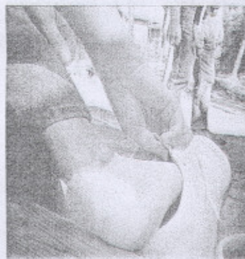
Vaellus vaati veronsa.