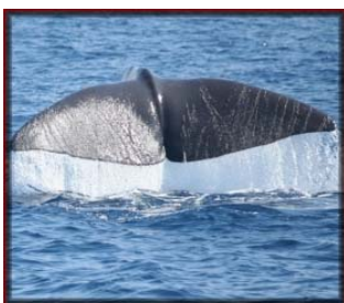
El GDR quiere impulsar las actividades relacionadas con los cetáceos o las aves en el Estrecho de Gibraltar