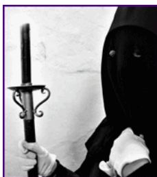
Visita la galería de la pasada Semana Santa