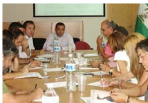
Reunión de la Junta directiva.